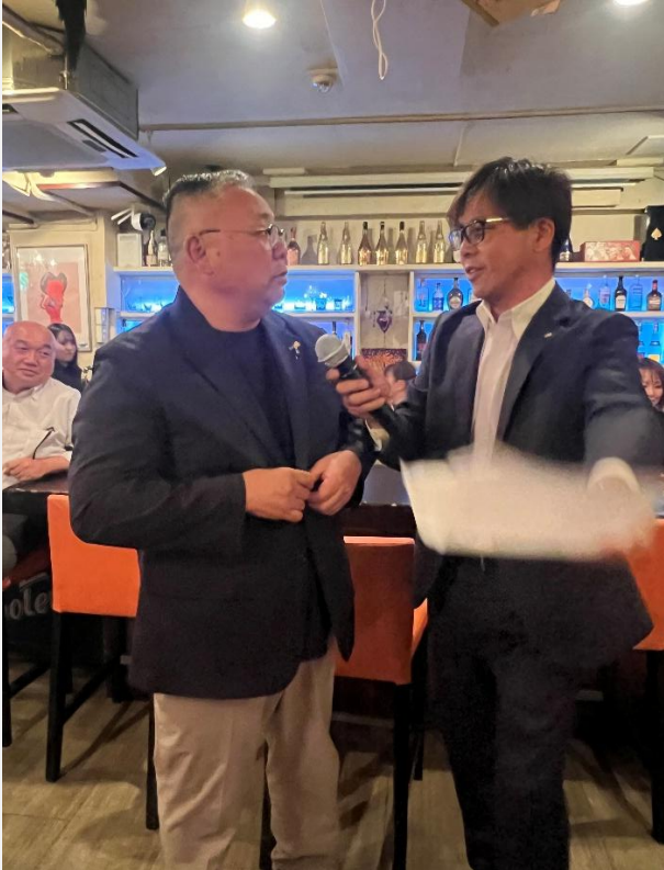
神の手ジャンケンの立役者神野会員