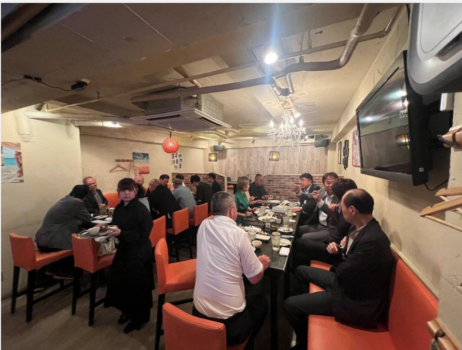
夜例会のち親睦中のみなさま