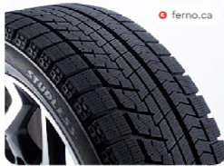
スタッドレスタイヤ