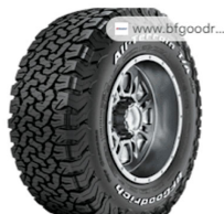
オールテレーンタイヤ